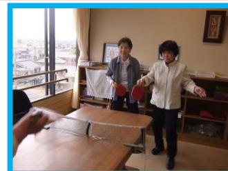
白熱！ピンポン大会！