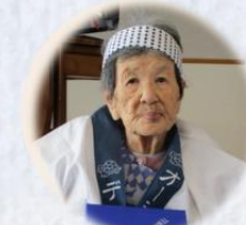
清板 愛子様 (オーシャンビュー鷺羽)