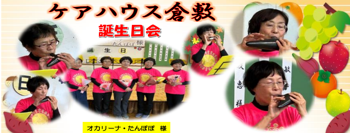
オカリーナ・たんぽぽ 様