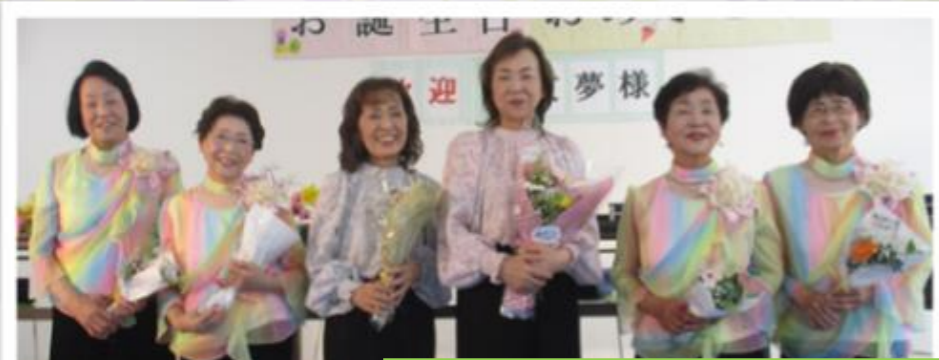
里桜花隊も頑張りました🌸

5月の誕生日会は、琴友夢様にお越しいただきました。大正琴の重なり合った音色は、とても綺麗でした♪途中楽しいトーク、合唱であっという間の時間でした