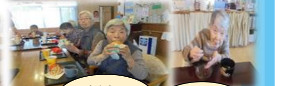
食事会 マクドナルド