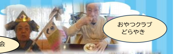
おやつクラブ どらやき