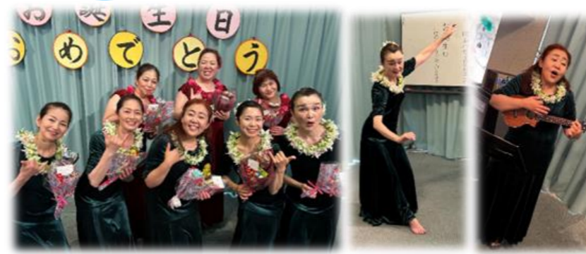
演芸では、フラ・ハーウ・オ・マーラ・プア 様にいただきました♪