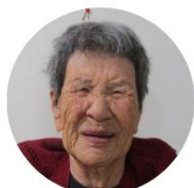
清板 愛子様 (オーシャンビュー鷺羽)