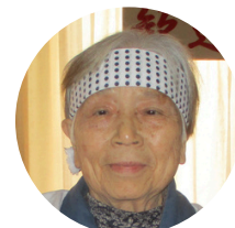
愛 道恵様 オーシャンビュー驚羽