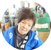
清板 幹枝様 オアシスユウ倉敷