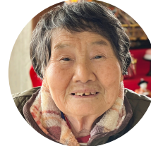
平勝 枝 様 ケアハウス倉敷